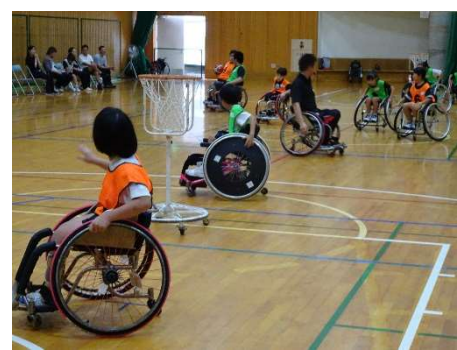
（ふれ愛プラザ写真）