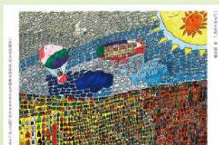
「にぎやかな町」 安 明日夢