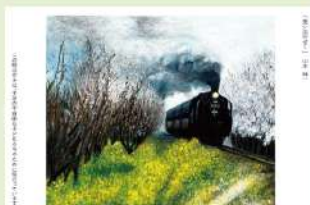
「思い出のせて」 山本 純一